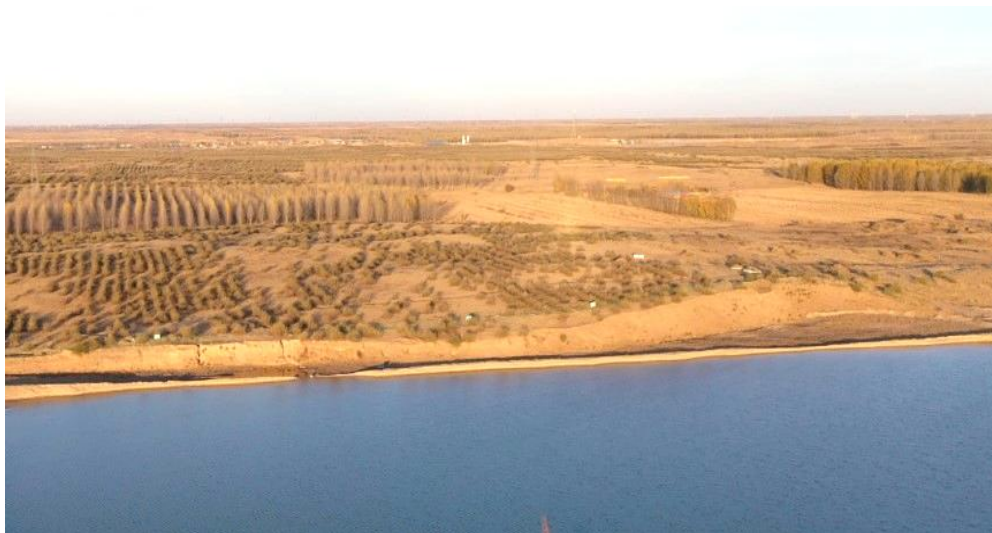
前期表土剥离区域照片

矿山前期表土剥离区，占地面积 0.5426 公顷，场地表面为渣土碎石，场地呈西北-东南向，北侧存在陡坎，长约 128cm，高平均约 7m，做为挡水坝。场地的建设与自然地貌景观不和谐，对地形地貌景观影响程度为较严重。